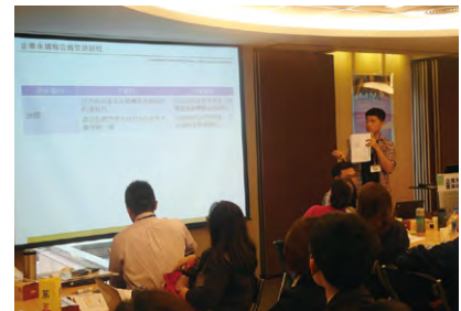
↑ 各組上台報告實際評比之觀察內容