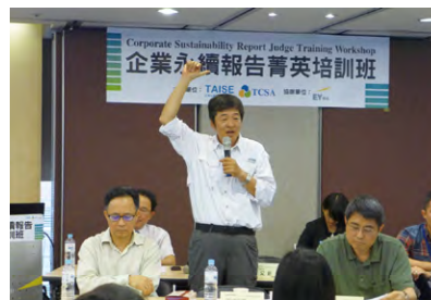
↑ 邀請評選委員到場聆聽學員進行發表並給予回饋

感謝對企業社會責任有使命感之企業CSR承辦人員、輔導驗證單位工作者積極協助《2015台灣企業永續獎》初選工作，完整評審員名單請見146頁。