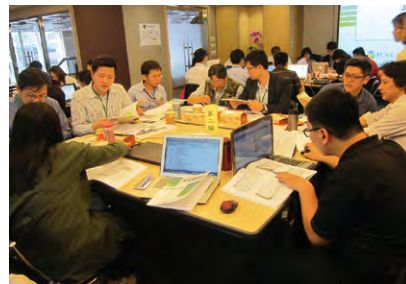
↑ 學員們互相討論，進行報告書實際評比

評選經驗，提升自身企業CSR出版水準。由今年度見習評審員所評比CSR的成績與表現中可知，本制度培育的評審員已具相當水準，評析能力已具鑑別功能，足見本制度之推動已順利達成預定目標。本屆評審員招募計畫能得以成功的最主要原因，除在於作法創新、切合企業需求，亦得力於各企業已開始重視CSR資訊揭露的工作，積極投入人力進行企業永續的推展。本基金會期望透過評審員招募計畫的持續擴大實施，培育企業永續專才，並協助公司提昇永續價值、共創社會向上提升之拉力。