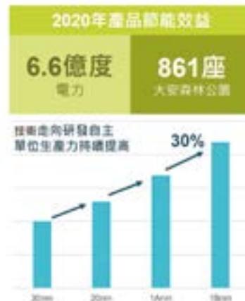
新世代產品能耗更低，傳輸資料量更多更快速

三大環境足跡進行重點改善：1. 推動節能政策減少生產電力耗用 2. 議合供應商執行能源管理方案 3. 增設樹脂塔再生酸性廢水收集系統減少氯化鈣用量。同時持續改善製程與產品效能，新世代產平均功率消耗約下降了 16%，新製程微縮晶片尺寸，使單片晶圓產能提升 30%。相同產能下，投入能源大幅減少，因此範疇三的產品使用排放隨之降低。2020 年客戶使用南亞科技低功率及 20 奈米消費性產品年度節省電力超過 6 億 5,847 萬度。南亞科技從生命週期與氣候相關風險出發，鑑別熱點加以減量改善，結合產品與製程創新，付諸氣候行動。