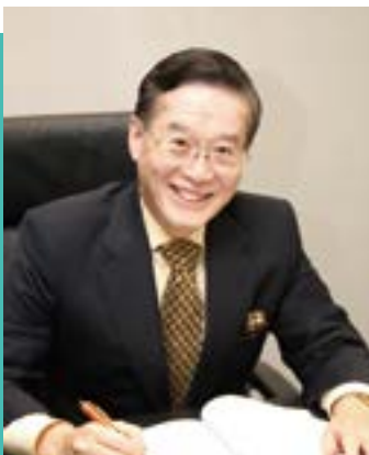
台灣永續能源研究基金會